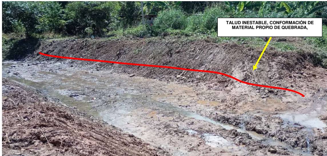
FIGURA N°01: TRAMO CRÍTICO EN LA QUEBRADA AGUA DULCE (AGUAS ARRIBA), EN EL SECTOR AGUA DULCE, DISTRITO DE UNIÓN ASHÁNINKA, PROVINCIA DE LA CONVENCION - CUSCO. TALUD INESTABLE MARGEN IZQUIERDA VULNERABLE A EROSIÓN.