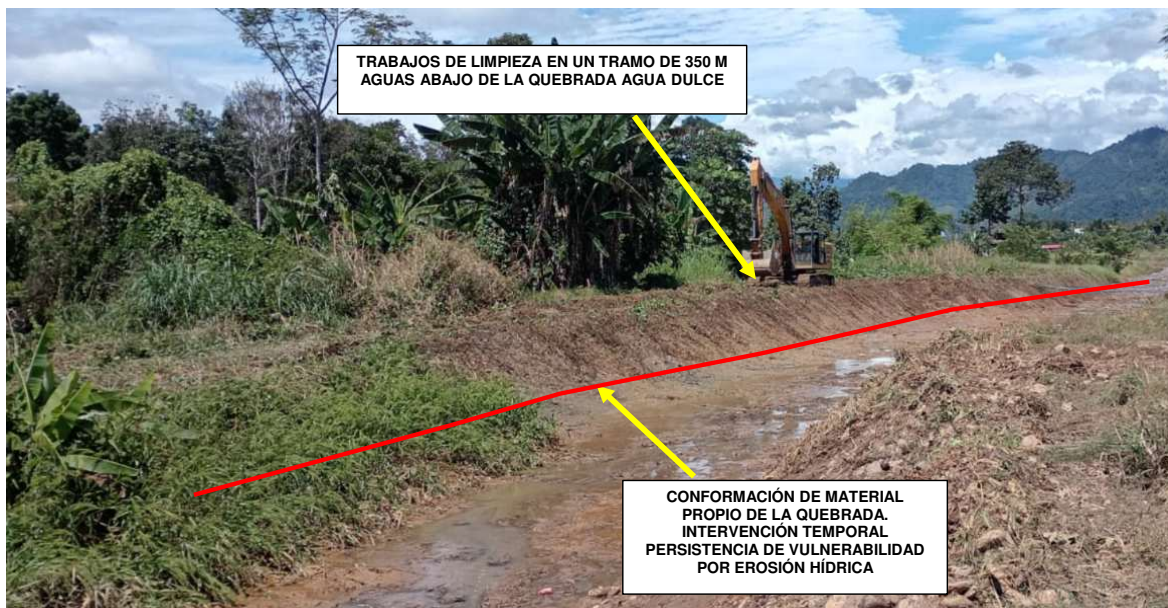
FIGURA N°02: VISTA DE INTERVENCIÓN MEDIANTE LIMPIEZA Y CONFORMACIÓN DE DIQUES CON MATERIAL PROPIO EN UN TRAMO DE 350 M. LA VULNERABILIDAD POR EROSIÓN HÍDRICA PERSISTE.